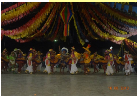
Quadrilha Estrela de Anajás Campeã do Concurso em 2013.

O X Forrozão Anajaense , versão 2014. Tem forró no coração do Marajó . Tem como principal objetivo realizar o evento da quadra junina na Cidade de Anajás, envolvendo as demais quadrilhas da Região do Marajó. Sendo ela nos estilo Tradicional quanto o estilo Estilizado (Pará - folclórico), Os dois estilos são conhecidos e trabalhados nas cidades marajoaras.